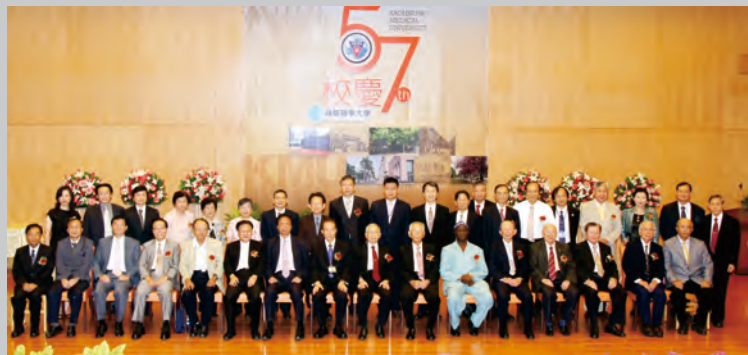
100年10月14日 57週年校慶表揚大會全體與會貴賓合影